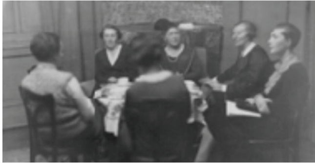
Erster deutscher Soroptimist International Club Gründung, Berlin, 1930

Soroptimist International ist eine der größten Service-Vereinigungen berufstätiger Frauen. Durch das weltweite Netzwerk ihrer Mitglieder und durch internationale Partnerschaften engagiert sich Soroptimist International für Menschenrechte, weltweiten Frieden und ehrenamtliche Arbeit.